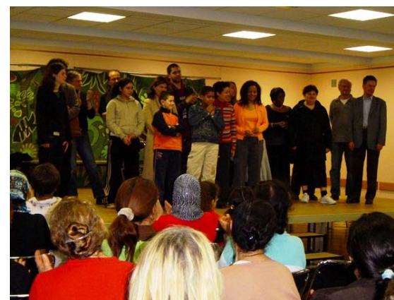
Les comédiens d'un soir issus du groupe Lutte Contre les Discriminations sud de la FD 92 lors d'une représentation du théâtre de l'opprimé au centre social Guynemert de Châtillon

Les premières journées sont en cours d'élaboration dans deux centres, l'objectif étant de pouvoir généraliser cette pratique dans les centres du Val de Marne et de l'Essonne.